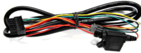
Cable de Energía