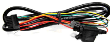
Cable de Energía